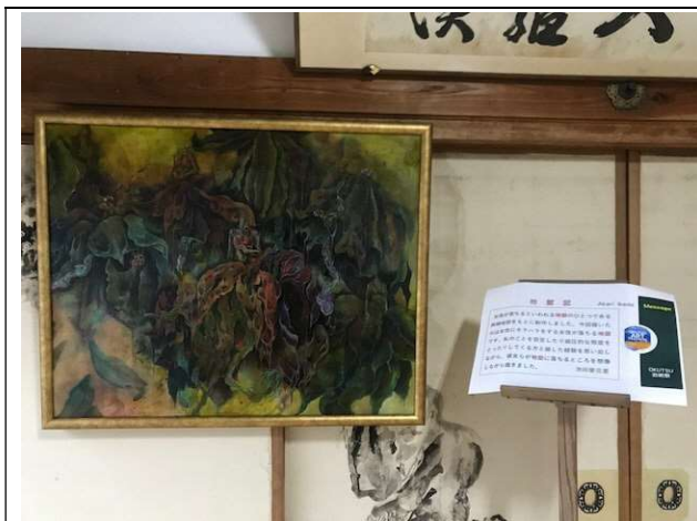
宝樹寺:地獄図プロジェクト