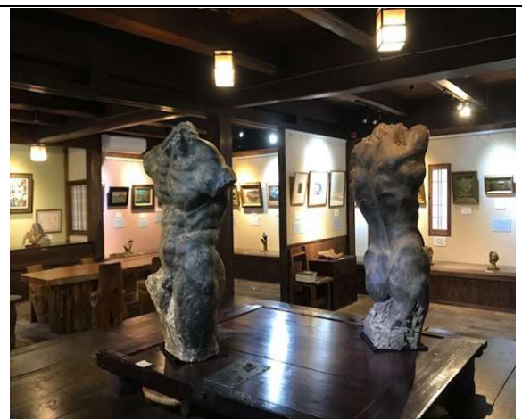
かがみの近代美術館:彫刻展示