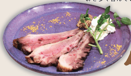
自家製イノシシの ベーコン 1,180円

猪肉は赤身はもちろんですが脂身も美味。疲労回復に効果があると言われるビタミンB群を多く含んでいます。