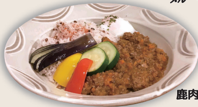
鹿肉のキーマカレー 1,280円