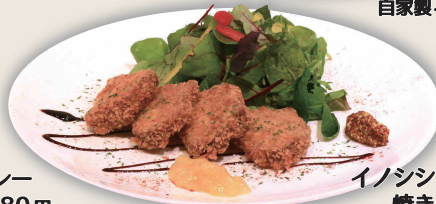
イノシシの一口カツ 焼きりんごソース 1,280円