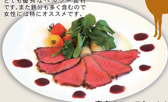
鹿肉のロースト 1,480円 スルーベリーソース