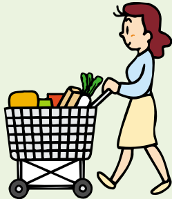
スーパーで買い物をする