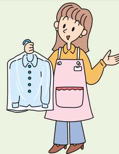
クリーニングに出す