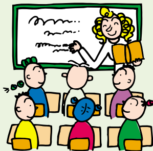
英会話教室に通う