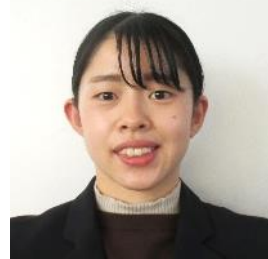
奈義町立奈義小学校 教諭

奈義町では、家庭や地域、学校同士の連携によって、町全体が一体となって子どもたちを育てています。ぜひみなさんも、奈義町の小中学校の一員として、一緒に頑張りましょう!