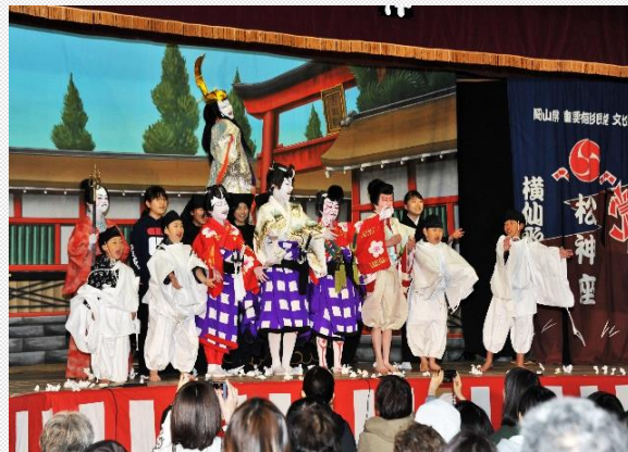
こども歌舞伎教室

奈義町には江戸時代から続いている、伝統芸能「横仙歌舞伎(よこぜんかぶき)」が継承されています。小学校4年生では、1年間授業で地域を知ることも兼ねて、実際に演じる勉強もしています。右の写真は、生涯学習教室の「こども歌舞伎教室」の様子で、幼稚園児から中学生の人までが参加しており、年2回の公演を目標に練習を頑張っています。