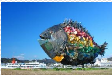
宇野のチヌ/淀川テクニク