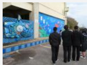
<小学生による職業体験> <豊かな海を守る取組>