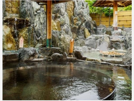
スポーツといで湯のまち 美作

美作市では、すべての子どもたちの自立を目指して、幼稚園・こども園・保育園から中学校卒業までの15年間を見据えた中学校区連携教育を推進し、家庭・地域と連携し子どもたちの豊かな心と確かな学力を育む取組を進めています。また、誰にとってもわかりやすい授業のユニバーサルデザイン化を推進しています。