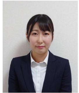
美作市立英田中学校 教諭

ぜひ、皆さんも自然に恵まれた美作市で、教員として子どもたちと共に学んでみませんか。皆さんとの「出会い」を楽しみにしています。