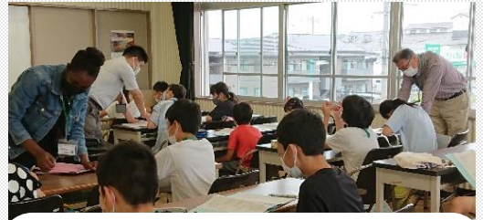
土曜英会話塾～実践的な英語表現～

小学生の夏休み中の体験活動を地域や大学生がスタッフとして支える「わくわくサマーホリデー」、中学生が高校生、大学生と共に実行委員として参加・運営し、開発した商品を販売する「花ござピンポン世界大会」、留学生を講師に迎え、実践的なレッスンを行う「土曜英会話塾」、大人や大学生と夢や生き方について語り合う「中学生だっぴ」等を開催するなど、早島の未来を担う、たくましい早島っ子を育てていくために、学校と家庭と地域の皆さんとが手をつなぎ、地域が一体となって、未来に生きる社会人を育てていきたいと思っています。