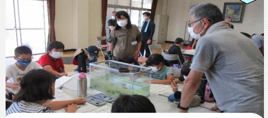
わくわくサマーホリデー～お魚探検隊～

「早島町学校教育ビジョン」のもと、「地域とつながり未来を拓く早島っ子」の育成に向けて、「自立・共生・郷土早島を愛する心」を基盤として、15歳の春を見据え、保幼小中の教職員が一体となった取組を進めています。ESDとキャリア教育の視点を踏まえたカリキュラムなど、社会に開かれた特色ある教育課程で子どもたち一人一人の笑顔が輝いています。小中一貫教育を基盤に、「喜んで登校・満足して下校、行きたい・行かせたい学校園」を目指し、協働・協学・協育の町づくりを進めています。