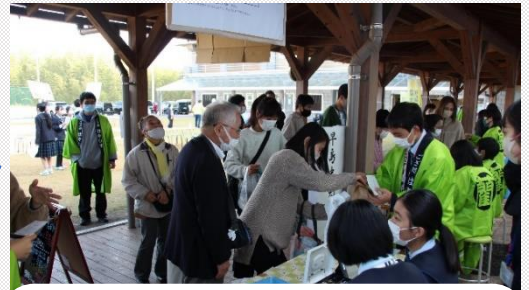
中学校起業体験～商品開発・販売～