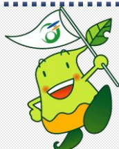
真庭市観光キャラクター 「まにぞう」