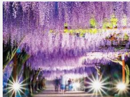
種類の多さでは日本一を誇る「藤公園」

英語教育、人権教育をはじめ、一人1台端末を使った探究的な学びにも力を入れており、園小中が連携した教育を目指しています。