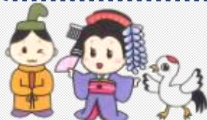
わけまるくん フジコちゃん タンタン 和気町マスコットキャラクター