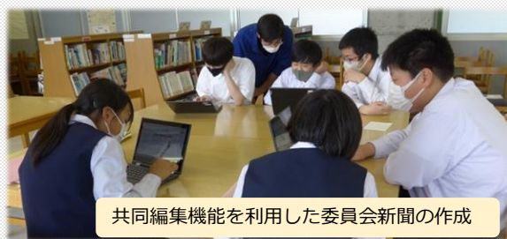
共同編集機能を利用した委員会新聞の作成

和気町では「GIGAスクール構想」の実現に向け、タブレット端末(Chromebook)を整備しました。児童生徒は、授業だけでなく、学校生活の多くの場面で端末を効果的に活用し、他者と協働した学び等を行っています。