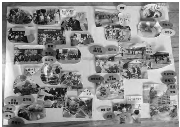
ドキュメンテーション

園での子どもたちの様子をイメージしやすいうように、「夢中になつて遊ぶ」姿を写真で定期的に掲示するようにした。写真と文字で表現するドキュメンテーション形式で、「何を学んでいるか」「どういう力につながるのか」というこ