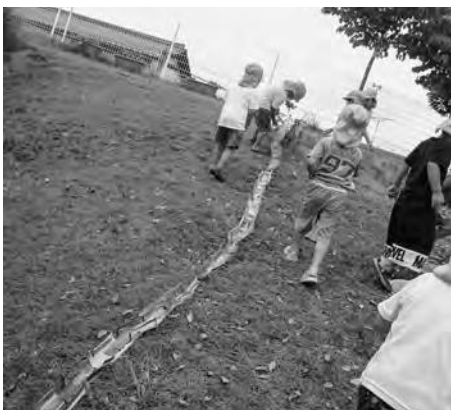
ペットボトルのウオーターライダー

とが伝わるように心掛けた。また、「幼児期の終わりまでに育つてほしい10の姿」と関連付けた表示を付け、子どもは遊びから様々なことを学んでいるということを知らせるツールとした。それを元に話をすることで、これまで以上に「様子が分かる」という声が返ってきた。またこの掲示物を作ることで、自分自身も保育を振り返ることにつながった。