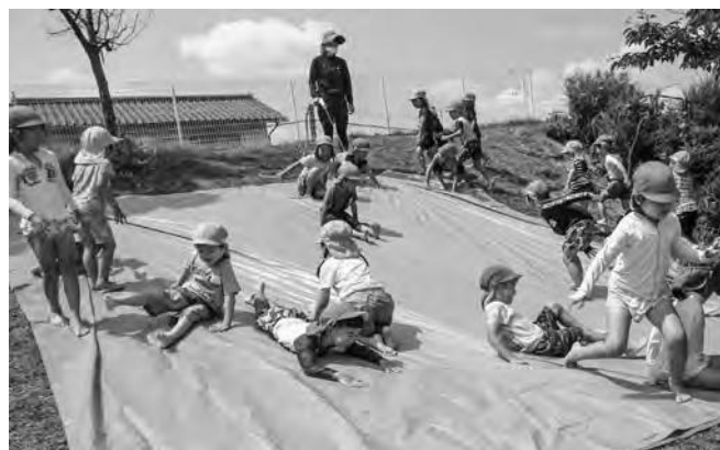
築山を利用した水の滑り台

降園したり、「今日は○○するって友達と約束してる」と意欲的に登園したりする姿になったように思う。