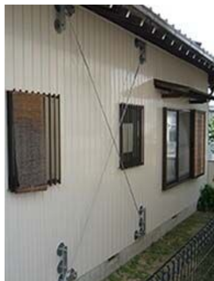
外部から金属のブレースで補強