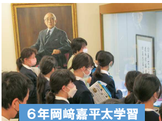
6年岡崎嘉平太学習