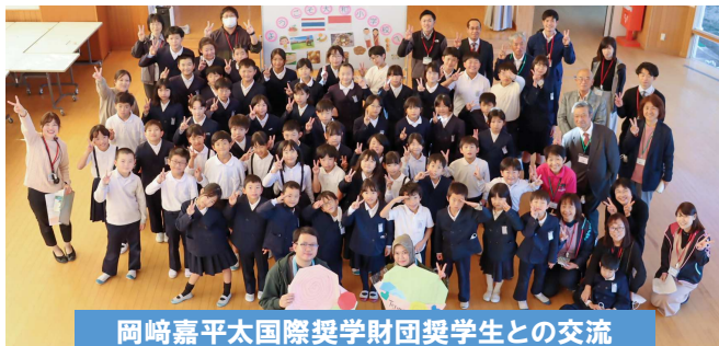
岡崎嘉平太国際奨学財団奨学生との交流