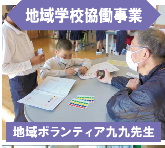
地域学校協働事業