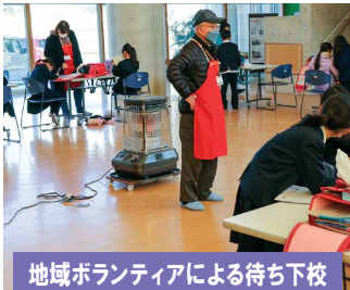
地域ボランティアによる待ち下校