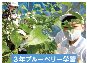
3年ブルーベリー学習