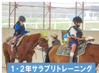
1・2年サラブリトレーニング