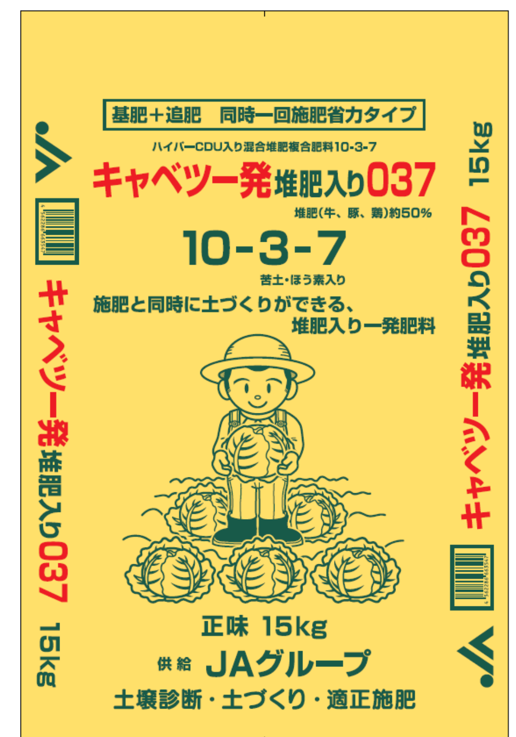
図2 製品「キャベツ一発堆肥入り037」