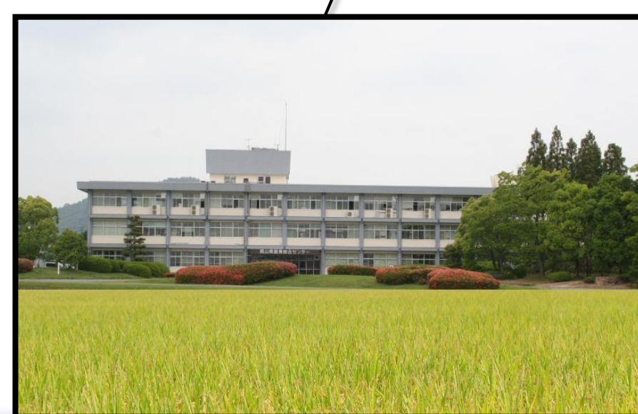
農林水産総合センター