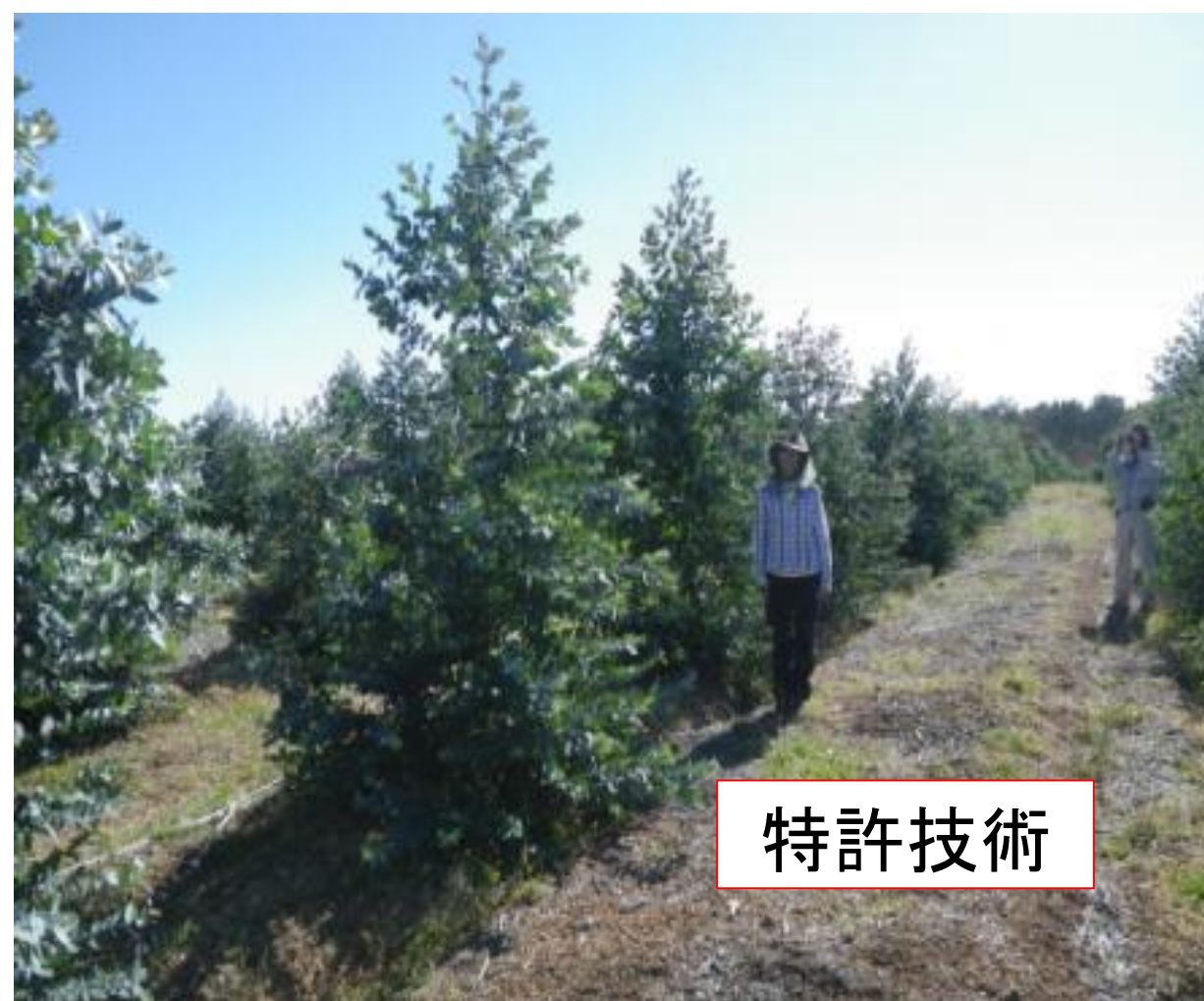
ユーカリ（西豪州試験地）

もちろん、植物の生育には、水、光、二酸化炭素のほか、体をつくるための窒素やリンなどの栄養素、そして適当な温度が必要です。「いい種子」があっても育成するための条件いい加減では「いい苗」にはなりません。わたくしたちは、保有特許によって生産性を大幅に向上させることができます（*参考）。その特許技術に使う資材を陸域や水域からのバイオマスで製造するための技術開発を目指します。