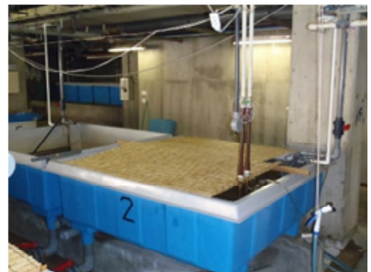
写真2：親魚飼育水槽