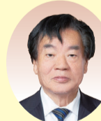
波多 洋治 議員