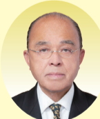
千田 博通 議員