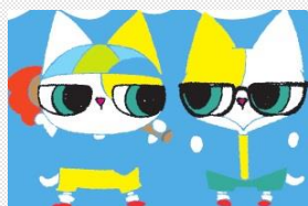
ろんご村の 双子の猫ちゃん

[基礎データ] 人口: 30,470人 学校数・児童生徒数: 小学校 10校・1,187人 中学校 5校・603人 (令和5年5月時点)