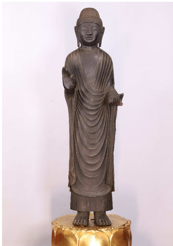
2 銅造如来立像 < (宗) 安養寺 所有 >