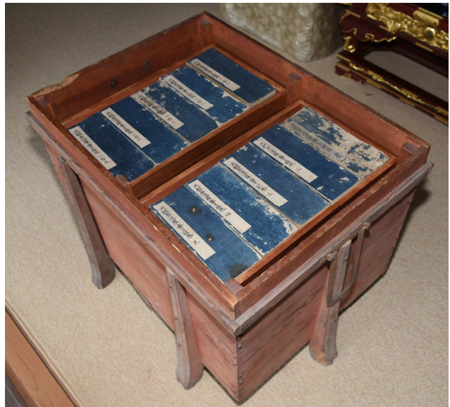
4 大般若波羅蜜多經 < (宗) 千手院 所有 >