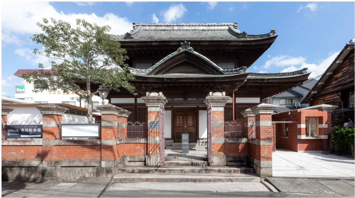
本館（外観） 門及び塀