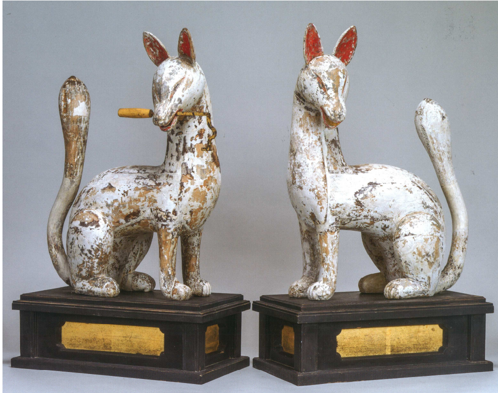
3 木造狐像 < (宗) 木山神社 所有 >