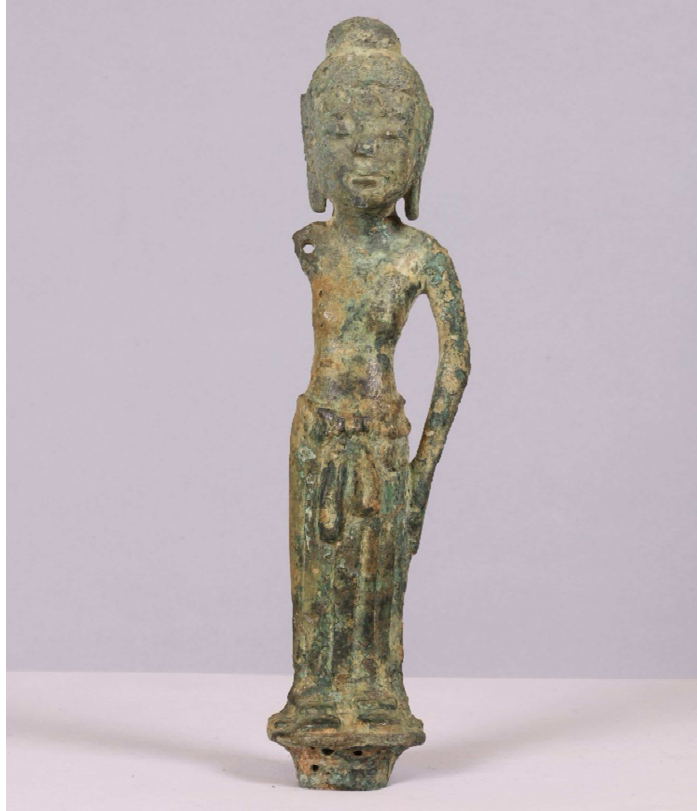
1 銅造誕生釈迦仏立像 < (宗) 安養寺 所有 >