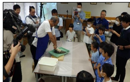
写真2 クロダイのさばき方の実演