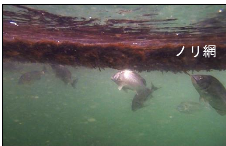
写真1 ノリを捕食するクロダイ