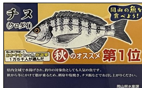
図2 クロダイの宣伝POP