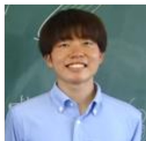
鴨方西小学校 教諭