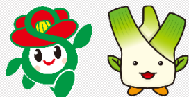
里ちゃん まこりん 里庄町マスコット

[基礎データ] 人口: 10,818人 学校数・児童生徒数: 小学校 2校・664人 中学校 1校・308人 (令和5年5月時点)