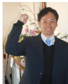
久米南町立弓削小学校 教諭