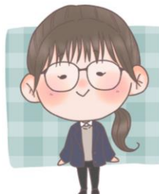
奈義町立奈義中学校 教諭