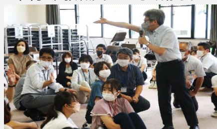
こども歌舞伎教室