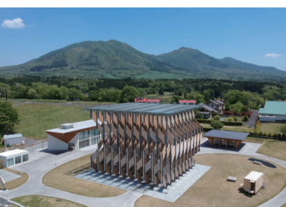
駐車場は向かい側のヒルゼン高原センター・ジョイフルパーク駐車場をご利用ください。