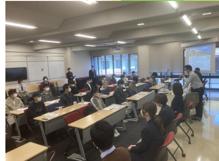
おかやま就活サポーター ホッネ交流会in京都産業大学 (2022.11.9開催)