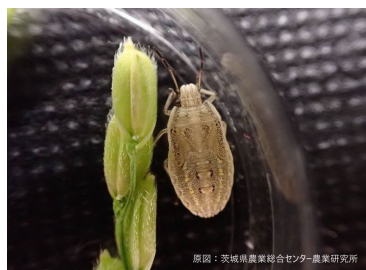
イネカメムシ幼虫（5齢）