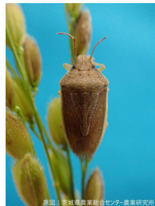
イネカメムシの成虫