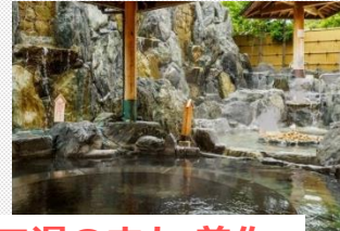
スポーツといで湯のまち 美作

美作の子どもたちは、地域の行事に参加する割合が全国平均に比べ高くなっています。(肯定的意見が小学校・中学校6割以上。全国平均は5割程度。) 地域を愛し、地域を大事にする子どもたちとともに、頑張ってみませんか。