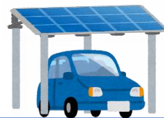
ソーラーカーポート