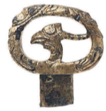
▲環頭大刀柄頭(史跡こうもり塚古墳)