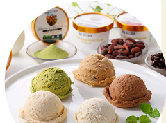
蒜山ジャージーアイス (旭川北漁協)