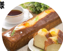
地元菓子店の焼菓子 (加茂郷漁協)