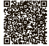
電子申請サービス

https://apply.e-tumo.jp/pref-okayama-u/offer/offerList_detail?tempSeq=38121