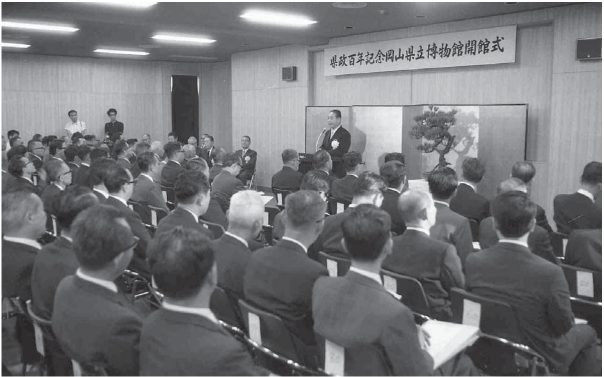
岡山県立博物館開館記念式典(昭和46年8月撮影)