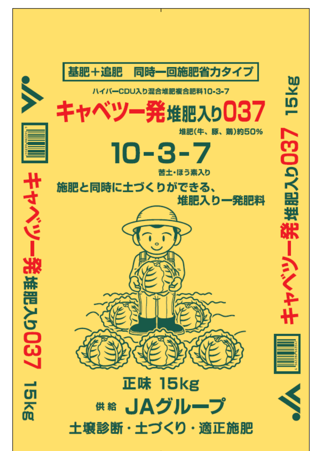
図2 製品「キャベツ一発堆肥入り037」