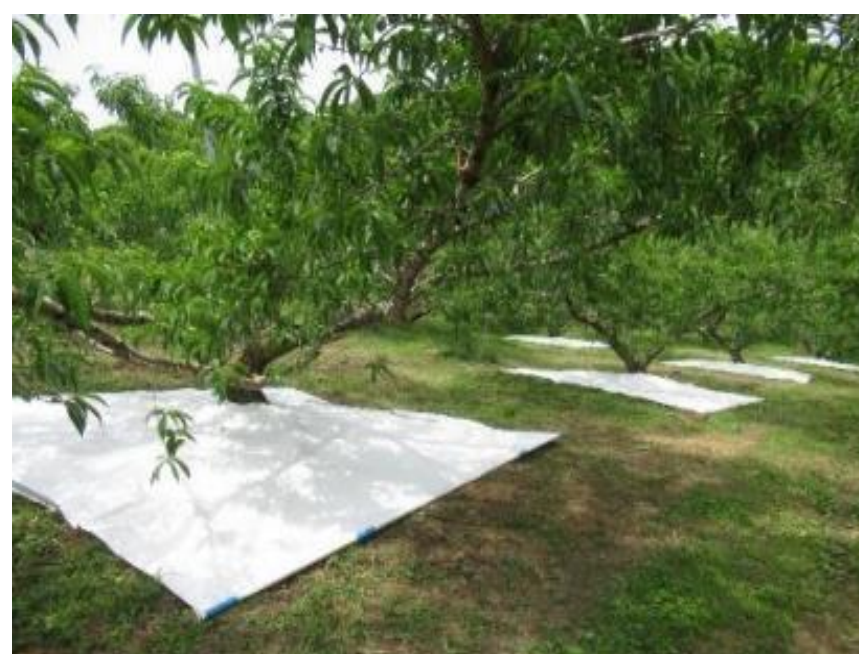
マルチによる桃安定生産技術の普及