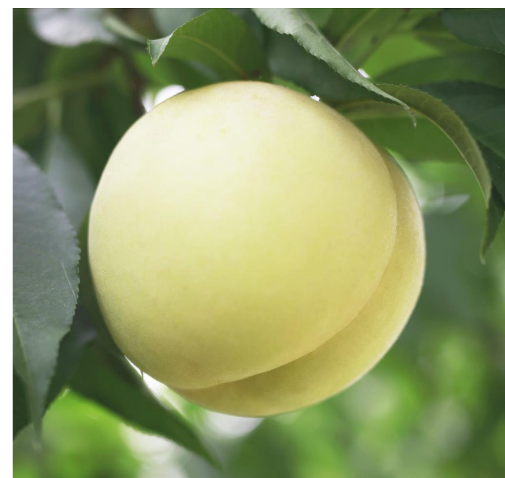
県育成品種「岡山PEH7号」（商標名 白皇）