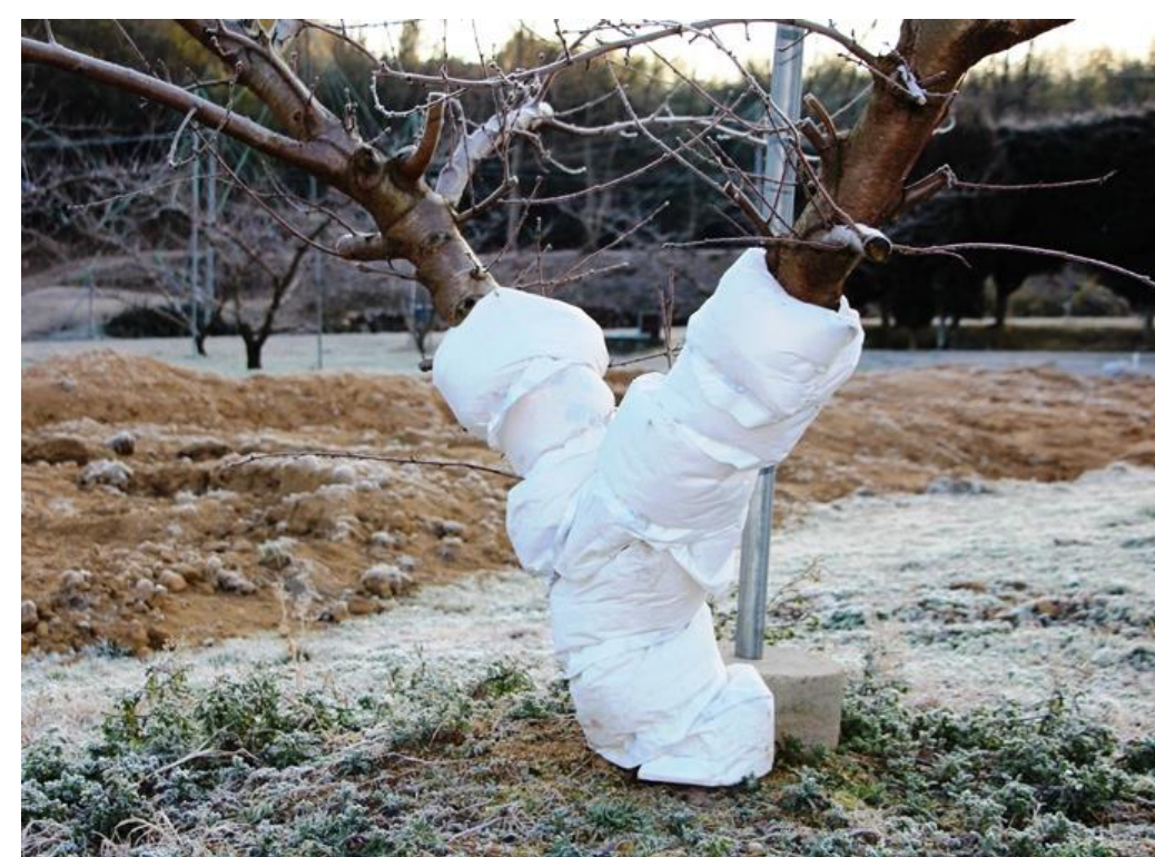
共同研究により開発した、ヒノキのカナナ屑を有効活用した果樹の凍害防止資材

県産農林水産物を活用した新たな商品の開発や販路拡大等の6次産業化に意欲ある農林漁業者等を支援しています。