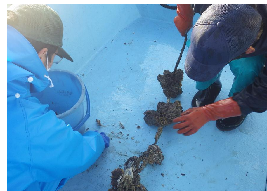
マガキの試験養殖