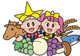
岡山県マスコット ももっち、うらっち