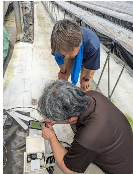
自作可能なCO 2 モニタリング装置等の開発 コンソーシアム(令和5年度)