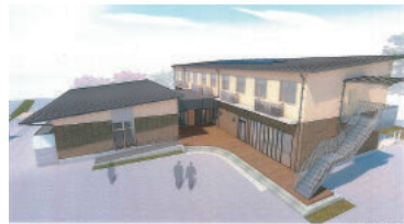
※図は完成イメージです。