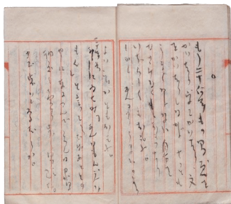
夢二雑文歌稿(写・自筆) 昭和5年(1930)