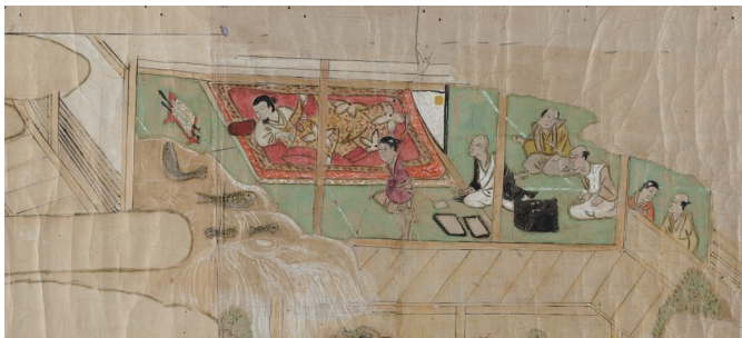
西大寺縁起絵巻(写・断簡) 寛文元年(1661) 部分