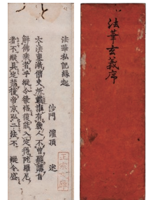
法華玄義序 文禄4年(1595)