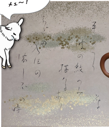
与謝野晶子色紙 昭和8年(1933)