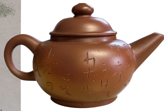
伊部焼朱泥急須 三代松田華山作 与謝野寛・晶子釘彫 昭和8年(1933)