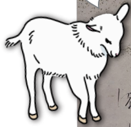
女王 (正宗家の 山羊)