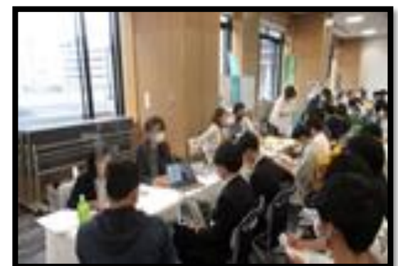
インターンシップマッチングフェア