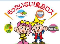
★「食品ロス」とは、まだ食べられるのに捨てられている食品のこと ©岡山県「ももっち」と「うらっち」