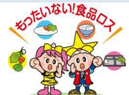
★「食品ロス」とは、まだ食べられるのに捨てられている食料のこと ©岡山県「ももっち」と「うらっち」