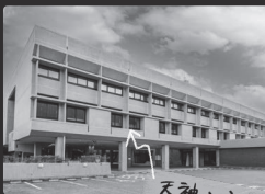
天神山文化プラザ

昭和37年に岡山県総合文化センターという名称で、図書館・展示室・ホールといった複合文化施設として開設しました。1階と2階をT字に直行させたような外観で、コンクリート仕上げでありながら鳥柱と名付けられたレリーフやデザイン的な空調の吹出口なども芸術的な部分も魅力的です。