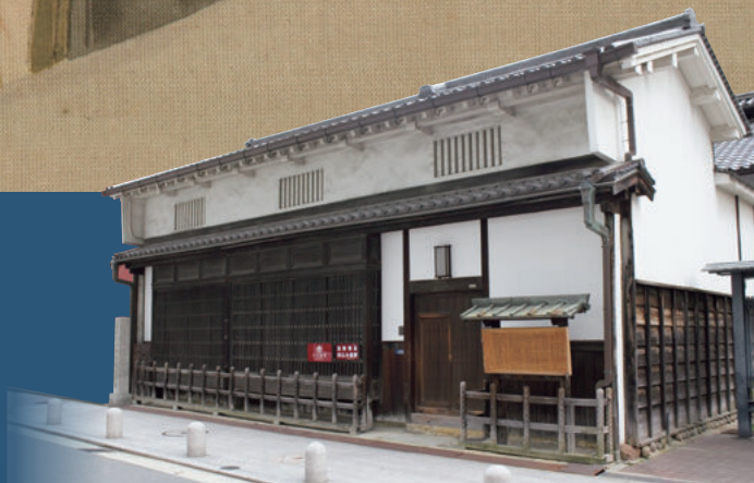
適塾(大阪市中央区北浜)

開館時間 | 午前9時30分～午後5時(開会初日のみ午前10時開館) 休館日 | 10月21日(月)、28日(月)、11月5日(火)、11日(月)、18日(月) 入館料 | 大人450円、65歳以上220円、高校生以下無料 ※11月1日(金)は無料開館(おかやま教育の日)