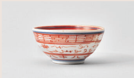
緒方洪庵母きょう米寿の賀盃 個人 足守で母きょうの米寿を祝う 洪庵最後の帰郷となる