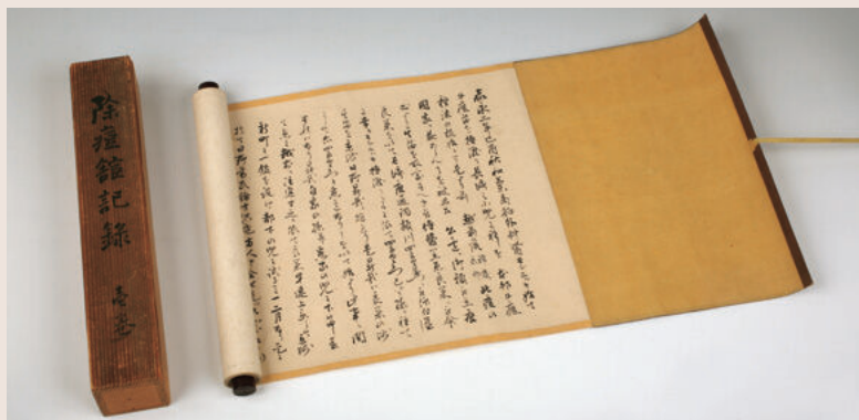
除痘館記録(部分) 大阪大学適塾記念センター 天然痘(感染症)から人びとを救おうとした洪庵たちの記録