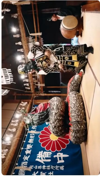
【岡山旅行】いざ、日本昔ばなしの世界へ🍓1泊2日で備中地域を旅しよう