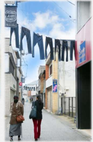
児島ジーンズストリート