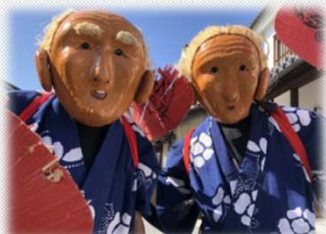
素隠居 (すいんきよ) も待っどるで～!