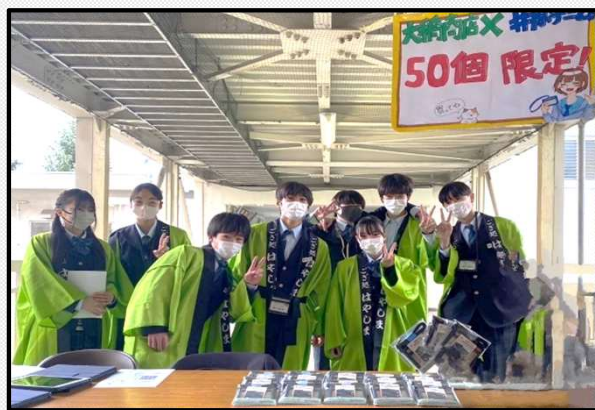
はやしまの日～早島町魅力アップ大作戦～

小学生の夏休み中の体験活動を地域や大学生がスタッフとして支える「わくわくサマーホリデー」、中学生が企業と協力して開発した商品の販売や、小さな子どもから高齢者まで楽しめるイベントを行う「はやしまの日」、留学生を講師に迎え、実践的なレッスンをを行う「土曜英会話塾」、大人や大学生と夢や生き方について語り合う「中学生だっぴ」等を開催するなど、早島の未来を担う、たくましい早島っ子を育てていくために、学校と家庭と地域の皆さんとが手をつなぎ、地域が一体となって、未来に生きる社会人を育てていきたいと思っています。