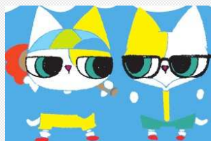
ろんご村の 双子の猫ちゃん