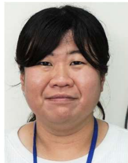
矢掛町立小田小学校 教諭

明るく素直で、元気な子どもたちや、どんなことでも優しく指導して下さる先輩の先生方が皆さんを待っています。ふるさと矢掛を愛する素敵な子どもたちと一緒に育てていきましょう。