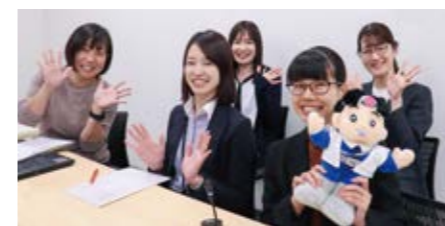
対面・オンラインでの採用説明会などを通じて、岡山県警察の将来を担う人材の確保、人的基盤の強化に努めています。