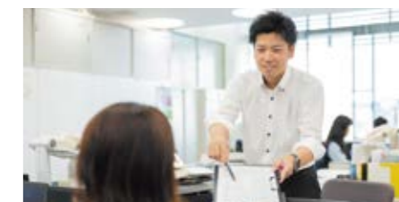
警察活動の基盤となる予算執行に関する業務を統括し、警察組織が効果的かつ合理的に機能するよう支えます。