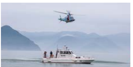
不測の事件・事故・災害などの有事の際は、県内外を問わず出動し、救出活動や捜索活動などを行います。