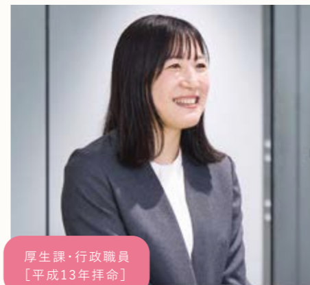
厚生課・行政職員 [平成13年拝命]

岡山県警察はさまざまな休暇制度や周囲の理解があり、家庭と両立しながら働き続けられる環境が整っていると感じます。また、警察行政職員の仕事は男女の差があまりないかもしれませんが、女性用トイレや仮眠室の設置検討の意見を出したり、女性ならではの気づきが役に立つ場面はたくさんあります。そして何より、警察という仕事は男女関係なく非常にやりがいのある仕事です。自分や周りの人が心身共に元気で、実力を発揮できる職場にしたいと思っています。