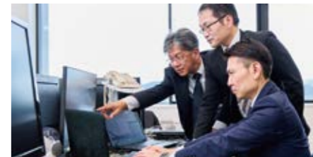
インターネット上で発生する犯罪の捜査や情報収集を行っています。