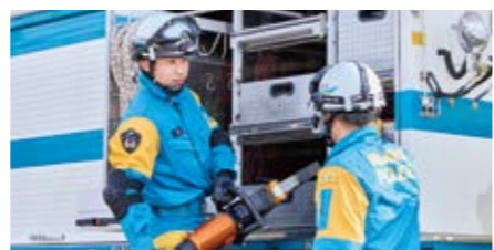
厳しい訓練により高度な技術や的確な判断力を培い、人命と治安を守ります。