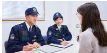
落とし物や困り事相談など、心情に寄り添った活動をしています。