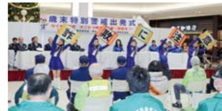
各種犯罪の抑止に向け、地域住民の方の防犯意識向上を目的とする広報イベントを企画・運営します。