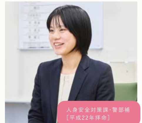
人身安全対策課・警部補 [平成22年拝命]

女性警察官の方に「警察官になりたい気持ちがあれば大丈夫!」と背中を押していただき、警察官を志望しました。警察官として働いていて感じる女性ならではの良さは、現場でよく「女性のお巡りさんは話しやすい」と言ってもらえることです。そして事件の被害者や相談者の方々から「警察に相談してよかった」と言われることが一番のやりがいです。これからも相手を尊重したコミュニケーションで県民に寄り添ってまいります。