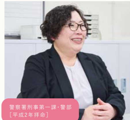
警察署刑事第一課・警部 [平成2年拝命]

警察官・警察行政職員を問わず、岡山県警察では多くの女性が活躍しています。ここでは育児休業などの制度面や、女性ならではの視点で見る警察という仕事についてインタビューしました。