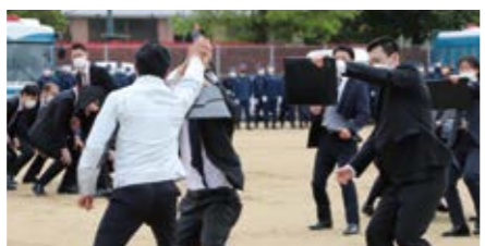
皇室や国内外の要人の警衛・警護を行います。