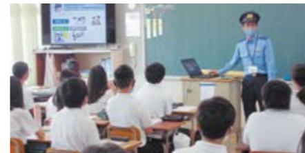
少年育成官や学校などと連携し、街頭補導、非行防止教室を通じて少年の健全育成を図ります。