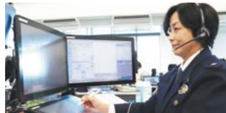
110番通報の受理と警察署などへの迅速かつ的確な指令を行います。

ストーカー、DV、サイバー犯罪などの取締りを行うほか、子供や女性の安全対策、少年の非行防止など、地域社会と連携して、犯罪を未然に防ぐ活動を行います。