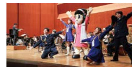
警察音楽隊は、演奏活動を通じて交通安全や防犯を呼びかけることで、安全・安心な社会の実現を目指しています。