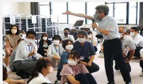
こども歌舞伎教室